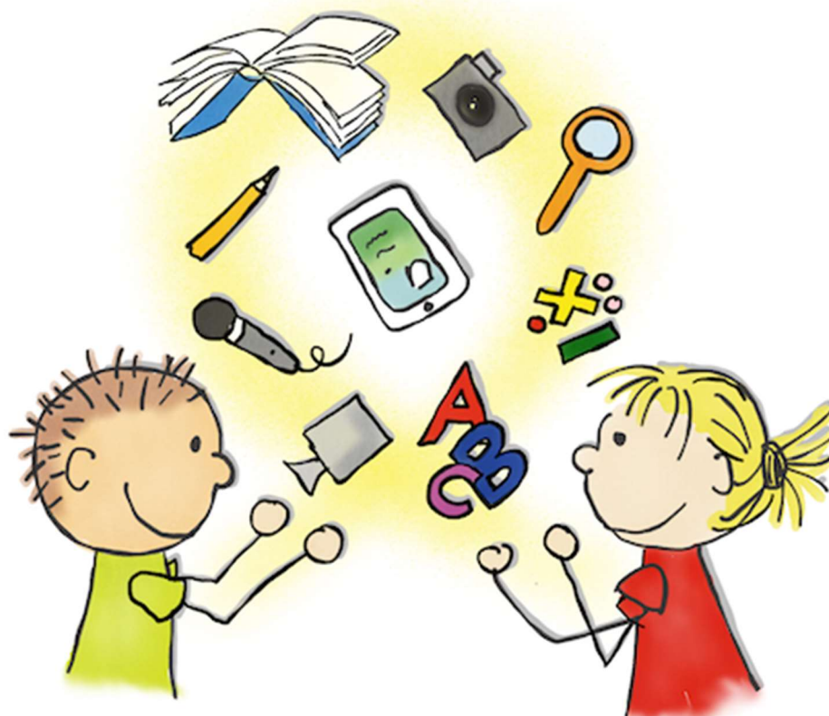
Abb. St. Maurer CC-BY-SA